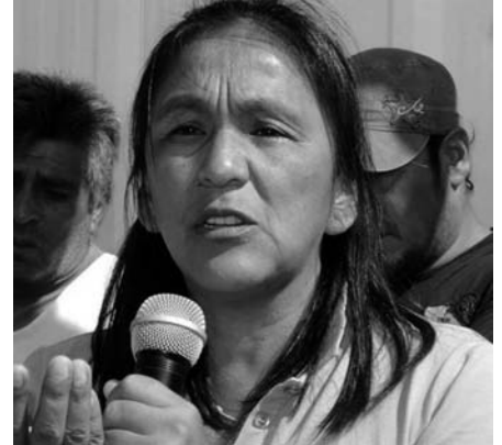
Milagro Sala, députée du Parlasur, prisonnière politique du régime Macri

Ph. P.- Il n'a hélas pas fallu attendre deux mois pour voir quel type de politique se mettait en place ! Dès son investiture, le 10 décembre 2015, Macri procède par décrets, sans passer par la voie parlementaire, à la remise en place brutale du modèle néolibéral, en attaquant sur tous les fronts.